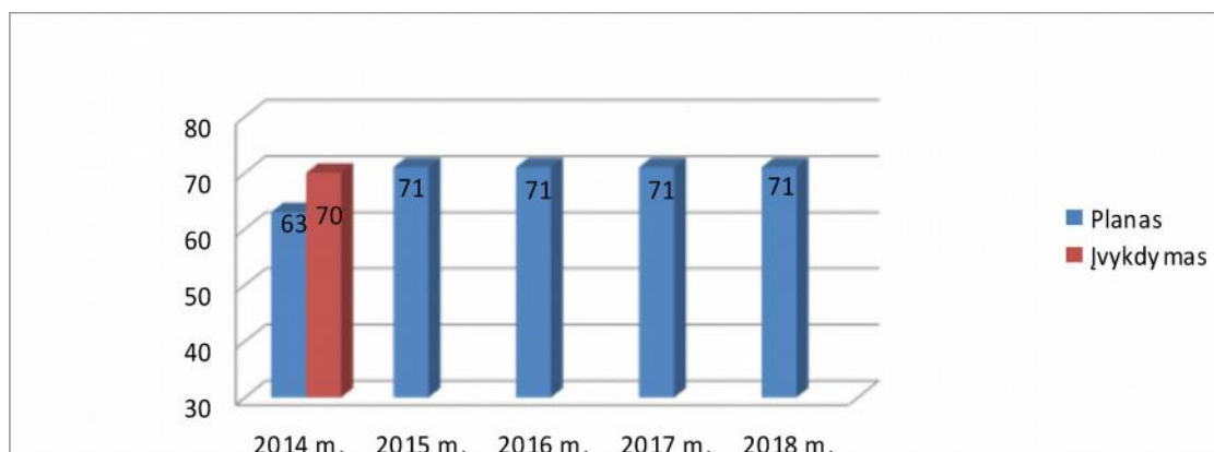
Visuomenės pasitikėjimas policija, procentais (kodas E-01-01)

STRATEGINIO TIKSLO (KODAS 01) Gerinti policijos teikiamų paslaugų kokybę PROGRAMA, EFEKTO VERTINIMO KRITERIJAI IR JŲ REIŠMĖS: